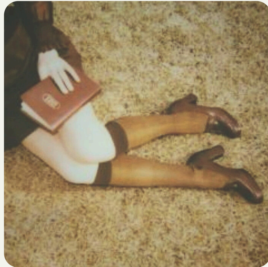
Passado de Ethel Cain